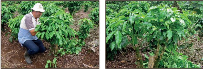
Figura 3. Mantener de 2-3 hijos máximo por punto de siembra, eligiendo los más vigorosos y mejor ubicados.