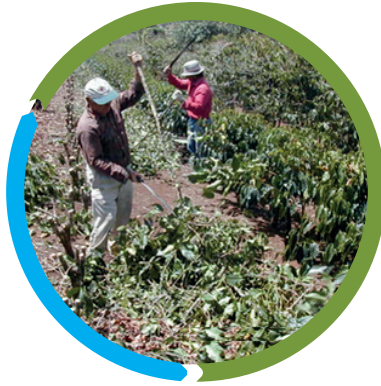
Figura 1. Distribución de restos de poda en las entrecalles.