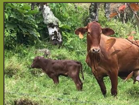
Vaca con encaste y ternera Senepol, con menos de un día de parida en la pastura, durante una noche de lluvia.

Pueden escribir al sabarca@inta.go.cr para cualquier consulta